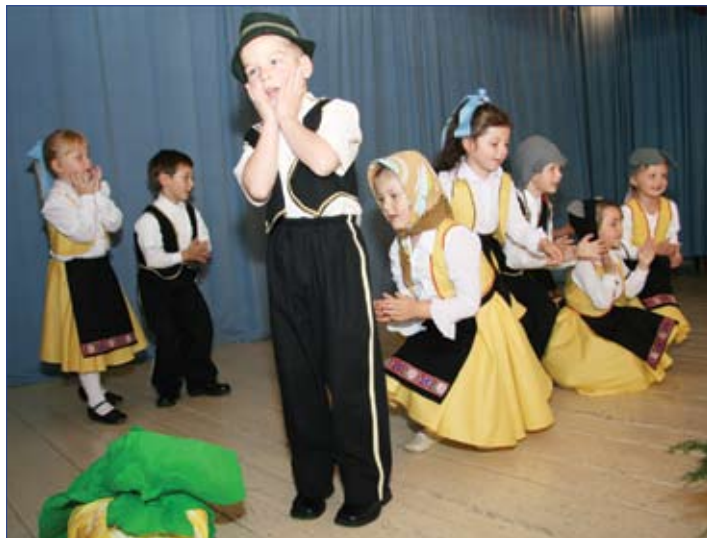
„Ďahal dedko repu...“ - a hoci sa školári smažili, repa sa vyťahnúť nedala.

Keďže nie všetci stárki mohli prísť, lebo im v tom zabránili zdravotné problémy alebo iné dôvody, chceme im aspoň prostredníctvom fotoreportáže v našich novinách priblížiť ako sa v kultúrnom dome oslavovalo.