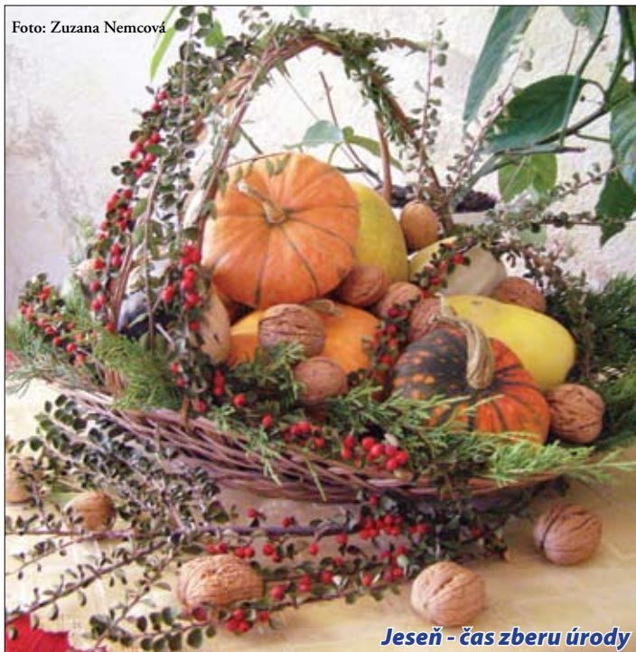
Jeseň - čas zberu úrody