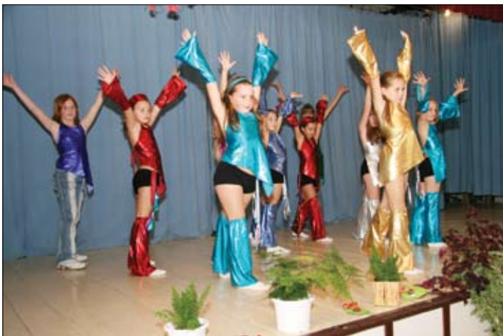
Melodická hudba, chytľavý rytmus a radosť z pohybu - to všetko priam sršalo z mladučkých tanečníc z polovskej základnej školy.